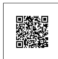
Zažádejte o vytyčení

GasNet, s.r.o. zastoupená společností GasNet Služby, s.r.o., IČ 27935311 Pavla Filipi Technik externích požadavků-Morava Oddělení zpracování ext.požadavků-Morava PAVLA.FILIPI@GASNET.CZ